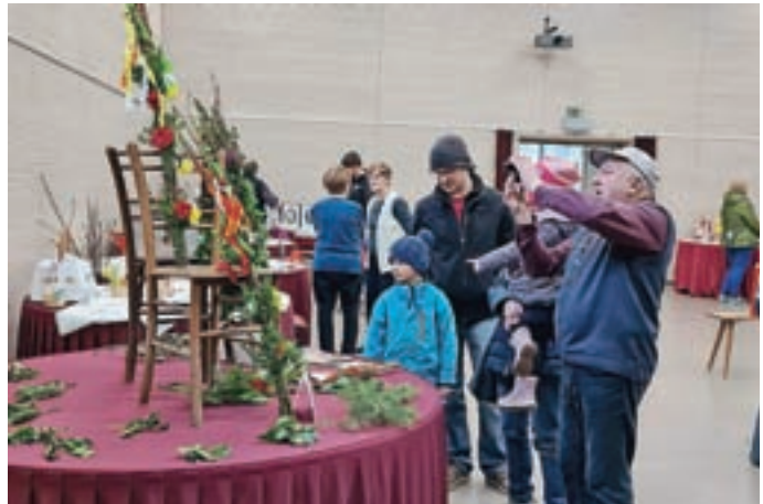
Razstavili so 14 butaric iz različnih slovenskih pokrajin.

Poleg butaric si je bilo na festivalu možno ogledati tudi velikonočne prte vezilj iz Društva upokojencev za Selško dolino, izdelke upokojenske sekcije Štrence, različne izdelke z velikonočnimi in pomladnimi motivi – od voščilnic,