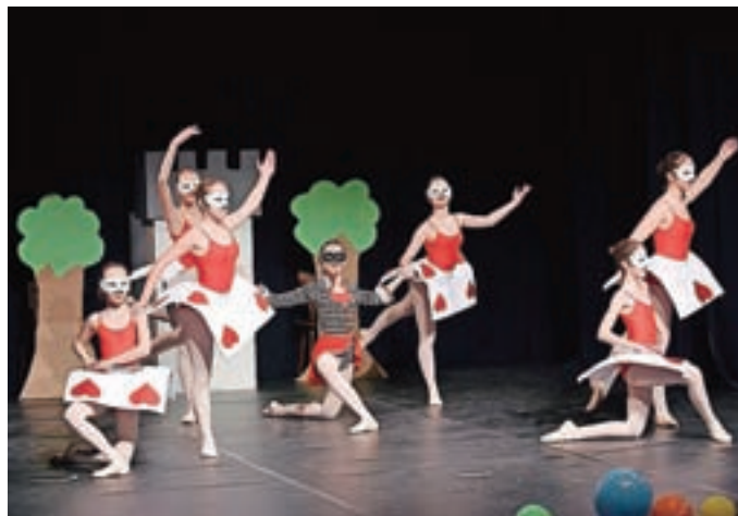
Baletna točka na Pustnem koncertu 2022

Svoje instrumente so mladi glasbeniki 5. aprila že predstavili svojim vrstnikom na osnovni šoli, v prvem tednu maja pa si bo možno v okviru tedna odprtih vrat tudi ogledati, kako poteka pouk. Oddelek v Železnikih lahko v prostorih OŠ Železniki in v Športni dvorani Železniki obiščete v torek, 3. maja, ma-