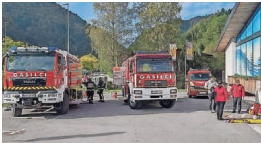
Utrinek s predstavitve PGD Železniki oktobra lani na parkirišču pred plavalnim bazenom

Ob koncu leta obiščemo občane s koledarjem in jih prosimo za prostovoljne prispevke. Za pridobljena finančna sredstva se vsem občanom iskreno zahvaljujemo. Prav tako pa gre velika zahvala vsem podjetjem, ki so nas podprla v obliki donacij. V društvu večino finančnih sredstev porabimo za posodabljanje gasilske opreme. Dosedanja oprema je postala stara in s tem ne izpolnjuje varnostnih standardov. Če hočemo dobro in uspešno posredovati, moramo opremo nenehno posodabljanje. S tem zagotavljamo lastno varnost in zmanjšujemo nastalo škodo na intervencijah. V naslednjem letu se pripravljamo na nakup novega gasilskega vozila s cisterno GVC-1. Pri nakupu nam bo v veliko pomoč Občina Železniki. Upamo, da nam bo s skupnimi močmi in dogovorom uspelo speljati nakup podvozja in nadgradnjo gasilske cisterne. Naša prva skrb in odgovornost bo še naprej odzivanje na klice na pomoč, saj s tem skrbimo za varnost občanov in občine.