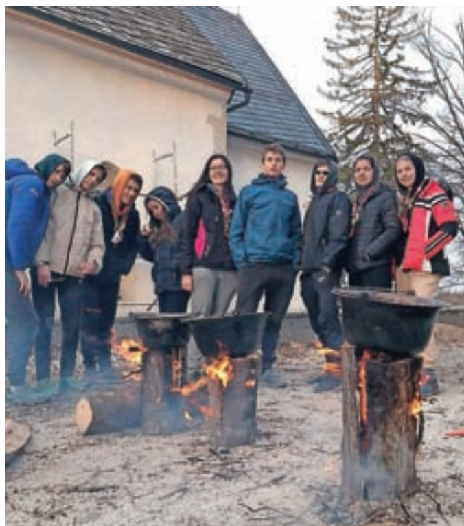
Najstarejša skupina je zimovala na Sveti Katarini.

Naša najstarejša skupina pa je zimovala na Sveti Katarini. V času, ki so ga preživeli skupaj, so glavni pomen dali grajenju skupnosti in odnosov. Na taboru ni manjkalo smeha, iger in zanimivih pogovorov, odpravili pa so se tudi na pohod na bližnji Jeterbenk, delali štruklje in jih skuhali na švedski bakli. Ker smo v postnem času, so pripravili tudi križev pot. Tabor