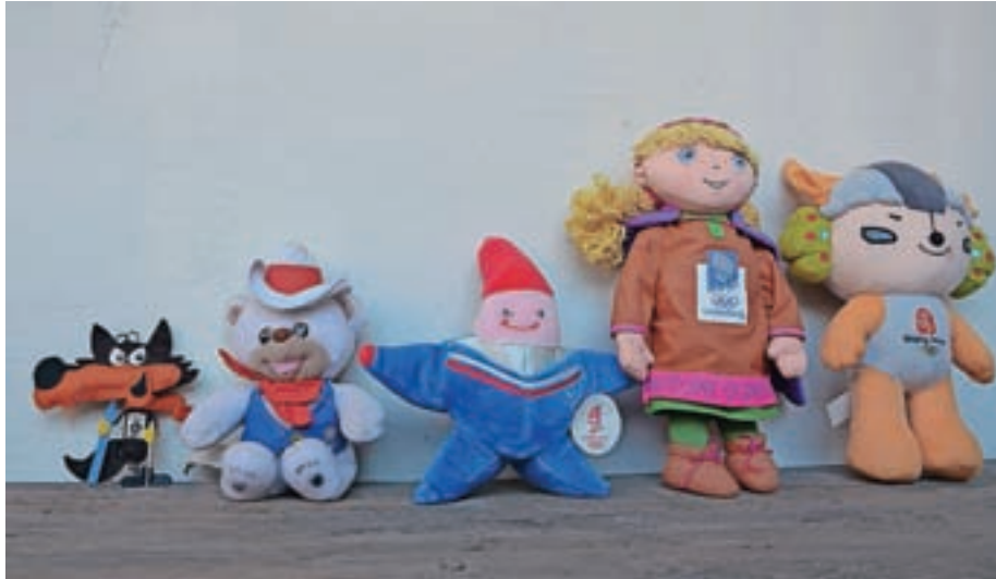
Maskote olimpijskih iger

Maskote olimpijskih iger 1984, 1988, 1992, 1994 in 2008 so del športne zbirke, ki bo postavljena v Športni dvorani Železniki.