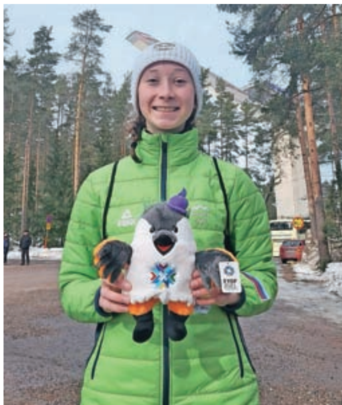
Nika je blestela tudi na olimpijskem festivalu evropske mladine na Finskem.

prišli ta konec tedna. Šele vi ustvarite Planico, kakršna je," je Cene pod Letalnico bratov Gorišek pojasnjeval po koncu zadnje tekme v sezoni. Zanj je bila najboljša doslej. "Zelo sem lahko zadovoljen. Ne bi iskal malenkosti, ki jih sicer vedno najdem. Za to sezono jih pa res ne bom. Čudovito. Najbolj v spominu mi bo ostal prav današnji najdaljši polet. To je vrhunec moje sezone, ki je bila za nas res izjemna. Ko pogledam za nazaj, je čudovito, da je bilo toliko fantov na tako visokem nivoju. Avstrijci so nam sicer v pokalu narodov dali tistih 47 točk, a mislim in upam si reči, da si bodo tudi oni letos bolj zapomnili nas," je dodal. Razveselil je z novico, da bo nadaljeval skakalno kariero. "Glede teh vprašanj lahko pomirim, da bom v prihodnji sezoni zagotovo še del reprezentance, da bom še skakal v Planici. Ostajam kot skakalec," je zatrdil. Kljub koncu skakalne sezone o dopustu v toplih krajih kot številni drugi ni razmišljal. "Verjetno bova poleti šla z dekletom po Sloveniji. Tudi Slovenija je lepa. Najprej je treba raziskati vse čudovite kraje pred domačim pragom, potem pa bomo šli še kam drugam."