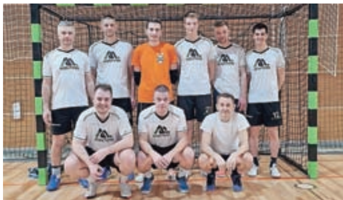
Zmagovalna ekipa Graffiti

Spomladi so se po daljšem premoru v Športno dvorano Železniki vrnili tudi turnirji. Tako je že bil izpeljan turnir uporabnikov športne dvorane v malem nogometu. Med petimi ekipami je bila najboljša ekipa Graffiti. Turnir v košarki poteka v dveh delih, prvi je bil že izpeljan in je štel tudi za jubilejne, 40. Športno rekreacijske igre. Zmagovalec turnirja bo znan ta konec tedna. Futsal turnir za ekipe iz vseh štirih občin na Škofjeloškem je bil zaradi premalo prijav odpovedan.