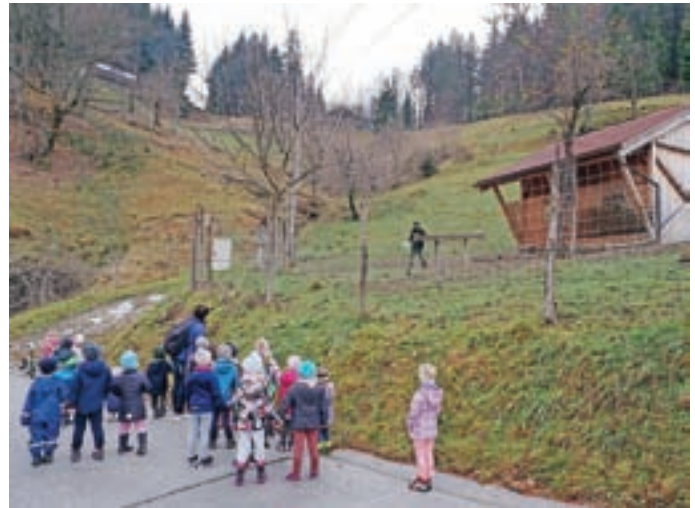
Obora z jeleni