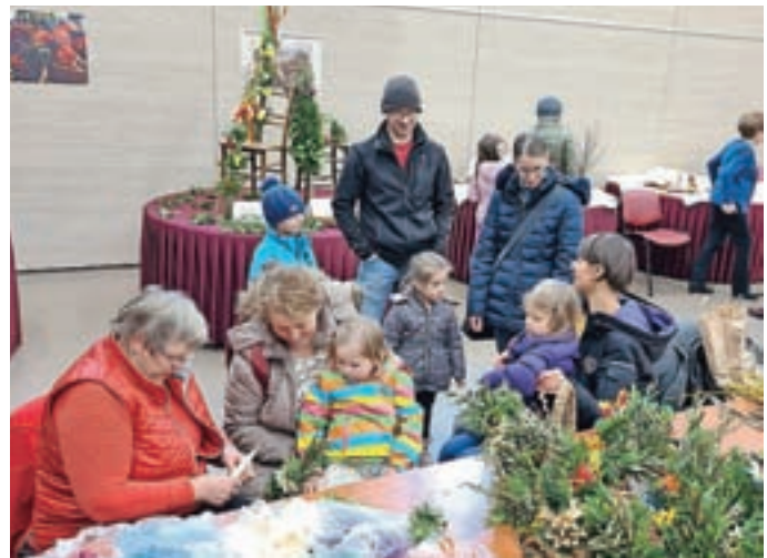
Obiskovalci so z zanimanjem spremljali izdelavo butaric; marsikdo si je izdelal svojo.