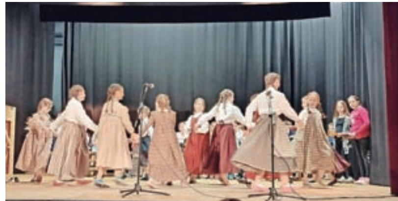
Zaplesala je otroška folklorna skupina.