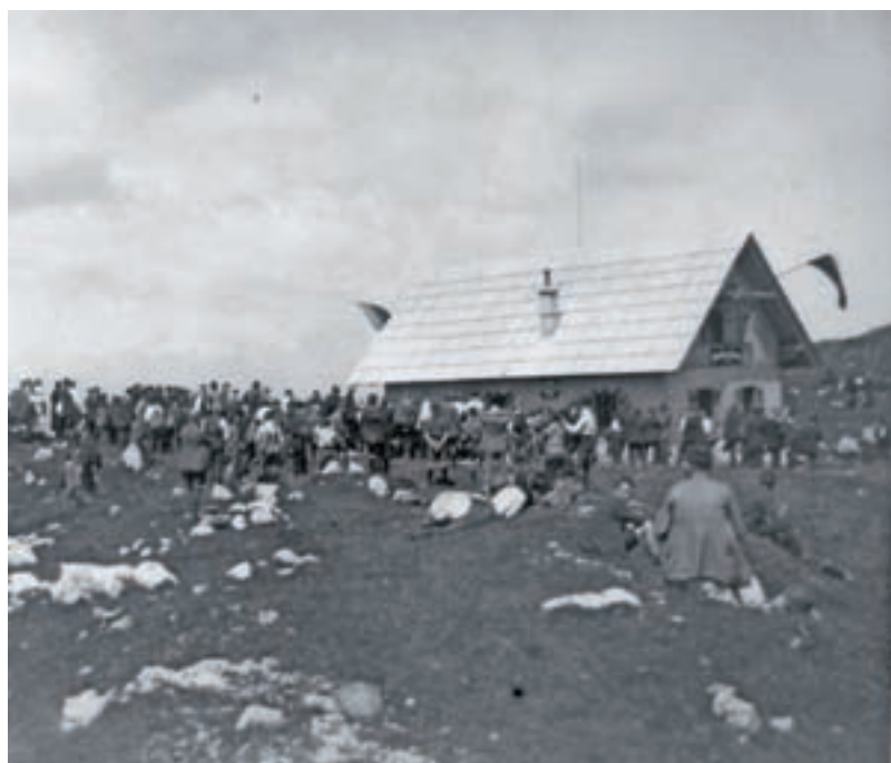
Slovesno odprtje Krekove kočas na Ratitovcu avgusta 1925, SI_ZAL_ŠKL/0154 Planinsko društvo Škofja Loka, t. e. 1, p. e. 9