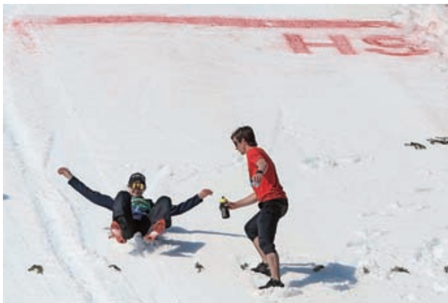
Cene se je v Planici veselil svojega osebnega rekorda (246 metrov). Po tekmi se je takole od rekordne znamke "odpeljal" v iztek.

smejo zaslepiti. Treba je vzeti v zakup, kar se je zgodilo, kako si do tega prišel. Tudi s slabimi rezultati se je treba sprijazniti, se iz njih kaj naučiti. Treba bo raziskati, zakaj so bili slabi in dobri konci tedna, zakaj se je na olimpijskih igrah naredil preskok, saj so bili treninzi in priprava na tekmo isti, telo pa je na skakalnici bolje delovalo. Te razloge je treba ugotoviti," je pojasnil 15. ska-