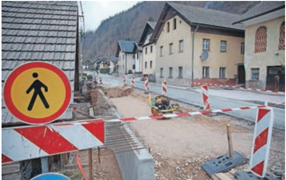
Investicija na Studenem bo končana predvidoma do 24. junija.

Spomladanska čistilna akcija, ki so jo minulo soboto načrtovali Občina Železniki, krajevne skupnosti, vaški odbori in društva, je zaradi slabega vremena za teden dni prestavljena in bo tako potekala to soboto, 9. aprila, od 9. do 12. ure. Udeleženci se bodo zbrali na običajnih zbirnih mestih. "Vljudno prosimo, da s seboj prinesete pripomočke: rokavice, grablje, motiko ..." so sporočili organizatorji. Komunala Škofja Loka bo na dan akcije poskrbela za odvoz zbranih odpadkov z zbirnih mest. Ob tem velja opozorilo, da akcija ni namenjena odvozu kosovnih in drugih odpadkov iz gospodinjstev. Več informacij je na voljo na spletni strani občine.