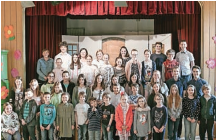
Nastopajoči, ki so staršem in drugim udeležencem prireditve ob materinskem dnevu polepšali večer