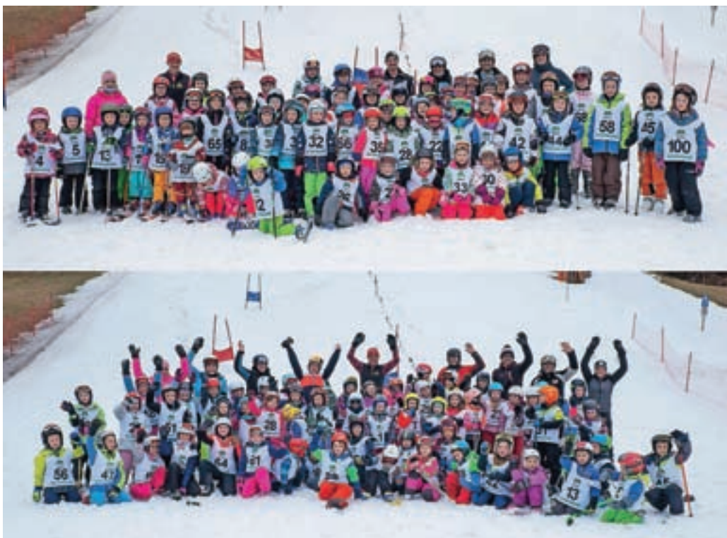
Tečaj smo zaključili 20. februarja na smučišču Rudno.

Letošnja zima nam je že zelo zgodaj postregla z ustreznimi razmerami za smučanje, nato pa so take razmere zdržale celotno zimsko obdobje. V Športnem društvu Dražgoše smo tako svoj tradicionalni tečaj smučanja začeli že 18. decembra. Letos smo ga ob upoštevanju nekoliko prijaznejših epidemioloških ukrepov glede smučanja po letu premora ponovno izvedli v načrtovanem obsegu. Udeležba na tečaju je bila izjemna, tečaj je večinoma potekal na Smučišču Rudno, del pa na Soriški planini. Trajal je 30 ur, dvakrat na teden po dve uri. Zaključek tečaja smo izvedli 20. februarja na Rudnem, kjer so se tečajniki pomerili na pravi tekmi med količki in s spodbujanjem komentatorja, na koncu pa za nagrado prejeli priznanje in čokolado ter se skupinsko slikali s svojimi učitelji. Otroci so bili na koncu veseli in zadovoljni, kakšen padec, solza ali slaba volja med tečajem pa so bili poplačani s ponosom in veseljem, ko se jim je uspelo samostojno peljati z vlečnico in spustiti po smučišču.